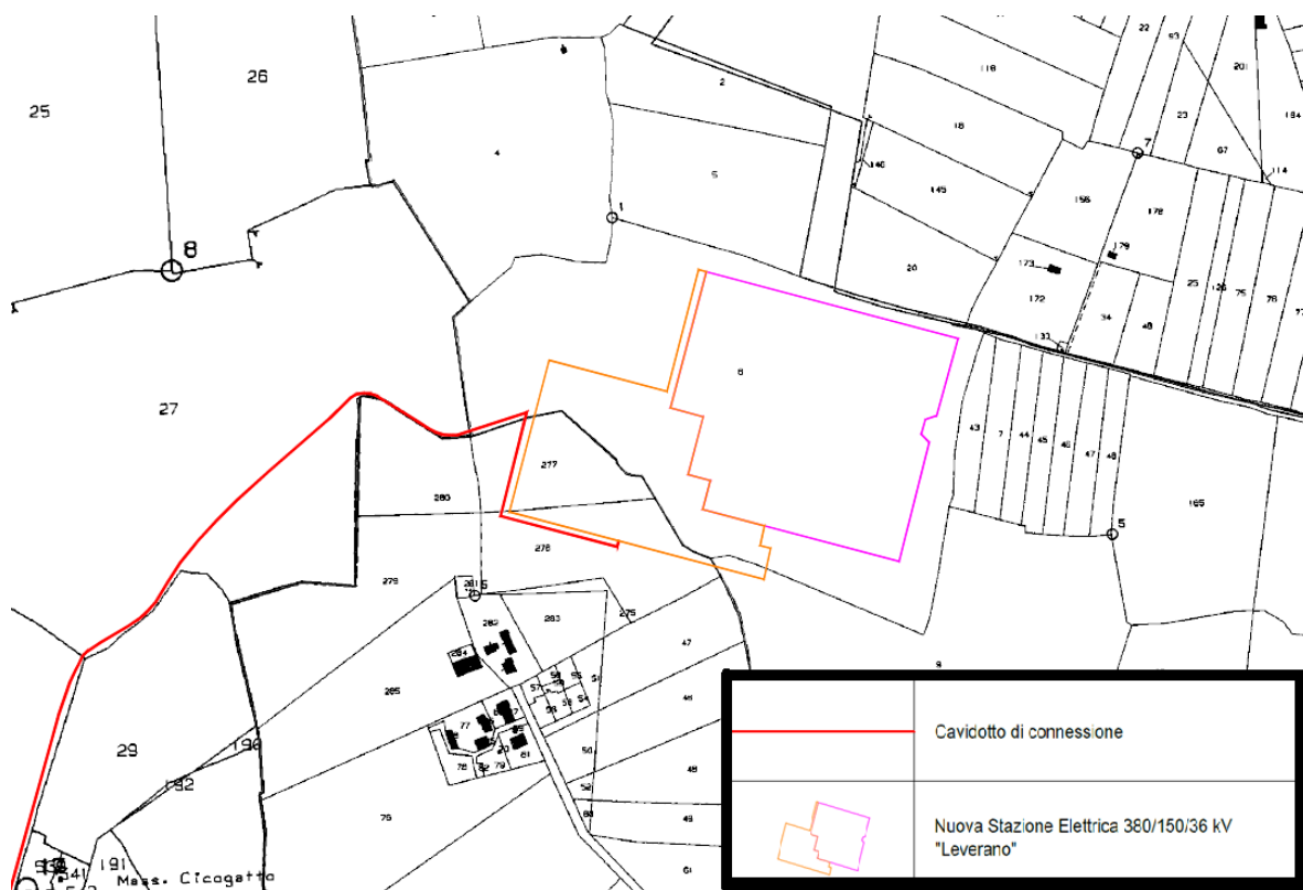
Figura 2. Dettaglio della parte finale del nuovo tracciato di cavidotto da sottoporre a Valutazione Preliminare (lunghezza complessiva 3.768 m).